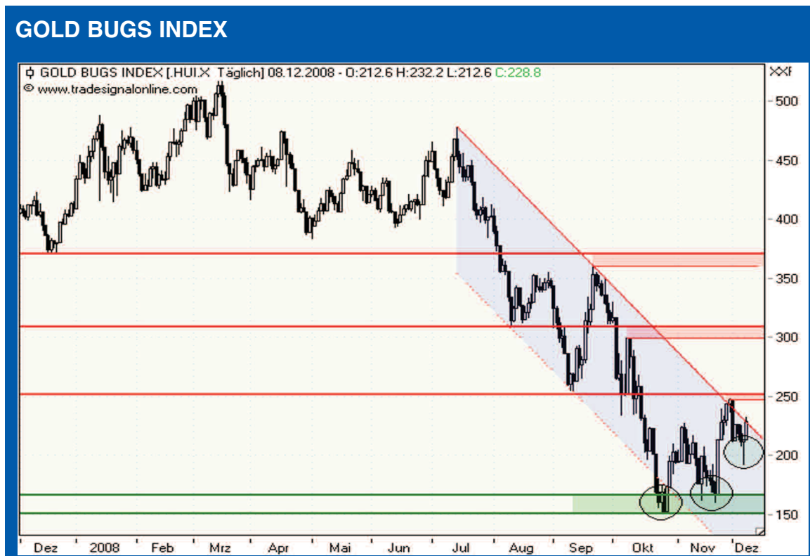
GOLD BUGS Index im Tageschart

In der kurzfristigen Betrachtung des Tagescharts zeigt sich das aufgehellte Bild unter anderem in den höheren Tiefs, die das Goldminen-Aktienbarometer zuletzt ausgebildet hat. Von Juli bis Oktober war dies den Aktien in ihrer beschleunigten Korrekturphase nicht gelungen. Dabei konnte der Index zuletzt auch einen kleinen Doppelboden (Kreise in der grünen Zone) ausbilden und diesen mit dem jüngsten Bruch des Zwischenhochs und dem folgenden Pullback auch bestätigen. Allerdings stoppte die Erholung jüngst an dem ersten horizontalen Widerstand um 250 Punkte, auf den die Kurse aktuell einen erneuten Anlauf nehmen. Zusätzlich arbeitet der Index am Bruch seines kurzfristigen Abwärtstrends. Nächsten Widerstand erwartet den Gold Bugs Index in einer fortgesetzten Erholung oberhalb von 300 Punkten aus Extrempunkten im Spätsommer und dann mit einer weiteren horizontalen Chartmarke bei 360-70 Punkten. Solide Unterstützung lässt weiterhin die Zone von 150 bis 165 Punkten (grüne Zone) erwarten. Hinzu kommen im weiteren Verlauf einer Erholung die genannten aktuellen Widerstände, die sich nach ihrem signifikanten Bruch zur Unterstützung wandeln. Tatsächlich hat sich das Chance-Risiko-Verhältnis bei den wichtigsten (Gold)Minenwerten zuletzt aus technischer Sicht wieder deutlich aufgehellt. Es gibt Anzeichen für eine fortgesetzte Stabilisierung des Amex Gold Bugs Index.