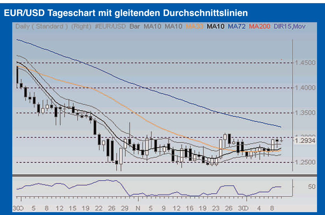
Oberer Chartabschnitt EUR/USD (MA33 orange; MA10 schwarz; MA72 Blau) Unterer Chartabschnitt: DMI blau bei 50%

Die USD –Entwicklung war wohl die größte Überraschung der letzten Krisenmonate. Salopp formuliert, wenn General Motors pleite ist und die Formel „GM = Amerika“ noch stimmen sollte, ist auf dem ersten Blick nicht nachvollziehbar, warum der US-Dollar solch eine Kursentwicklung vollziehen konnte. Hauptargument sind sicherlich die immensen Summen an USD, die aus Asien und Europa abgezogen und in die USA repatriert worden sind. Darüber hinaus ist auch Europa in die Rezession abgerutscht: mit der Möglichkeit weiterhin die Zinsen zu senken. Fallende Ölpreise und damit eine Entwarnung an der Preisfront scheint der EZB weiteren Spielraum für fallende Zinsen zu eröffnen. Damit konnte die EZB aktiv in den Kampf gegen die Rezession eingreifen.